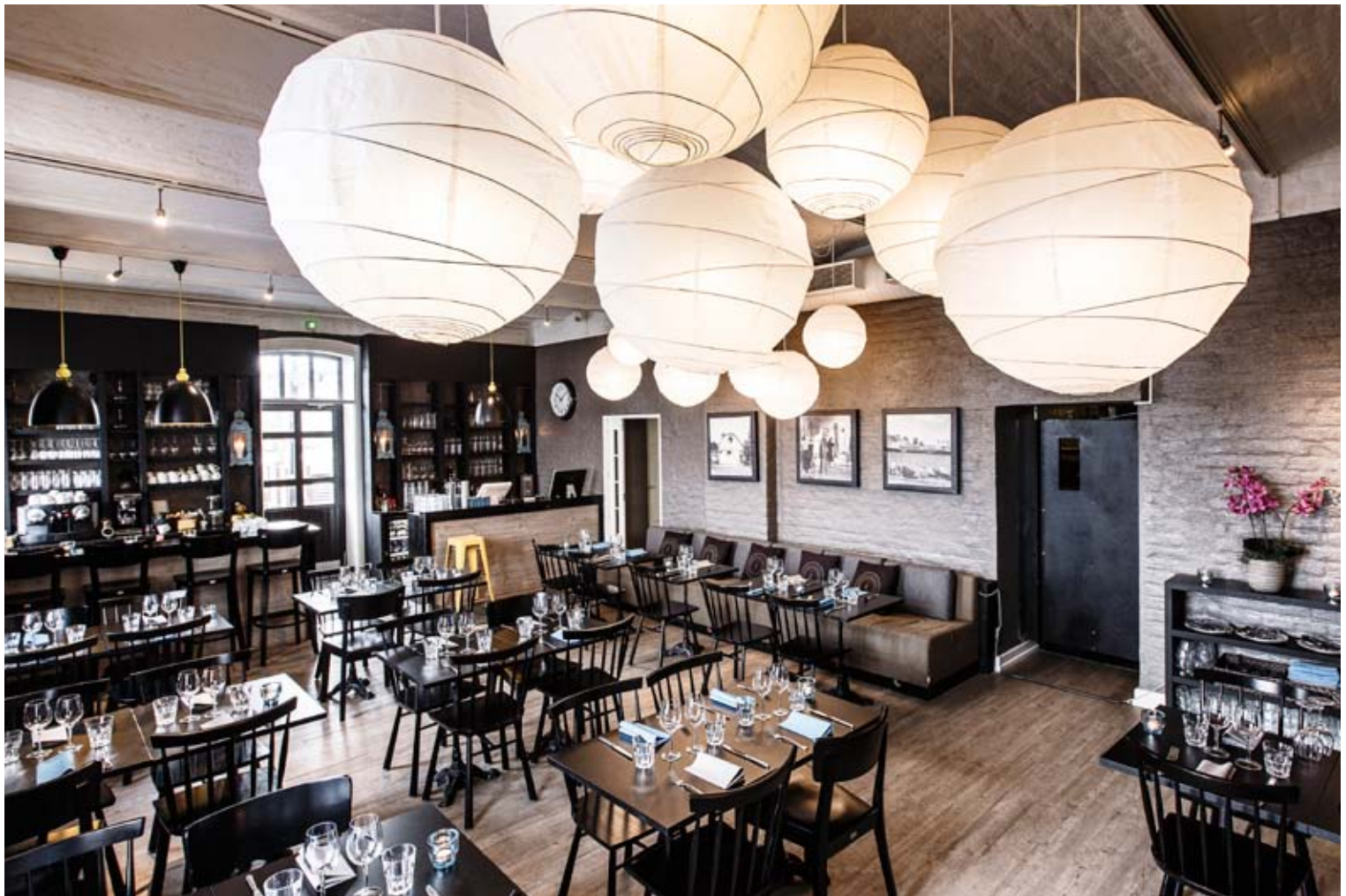
Wanha Makasiini Bistro Satamatie 4, Lappeenranta

Etusali baareineen toimii ravintolamme pääsalina, tilaan mahtuu noin 40 henkeä. Bistrotunnelmaa parhaimmillaan, Saimaa näkymin!