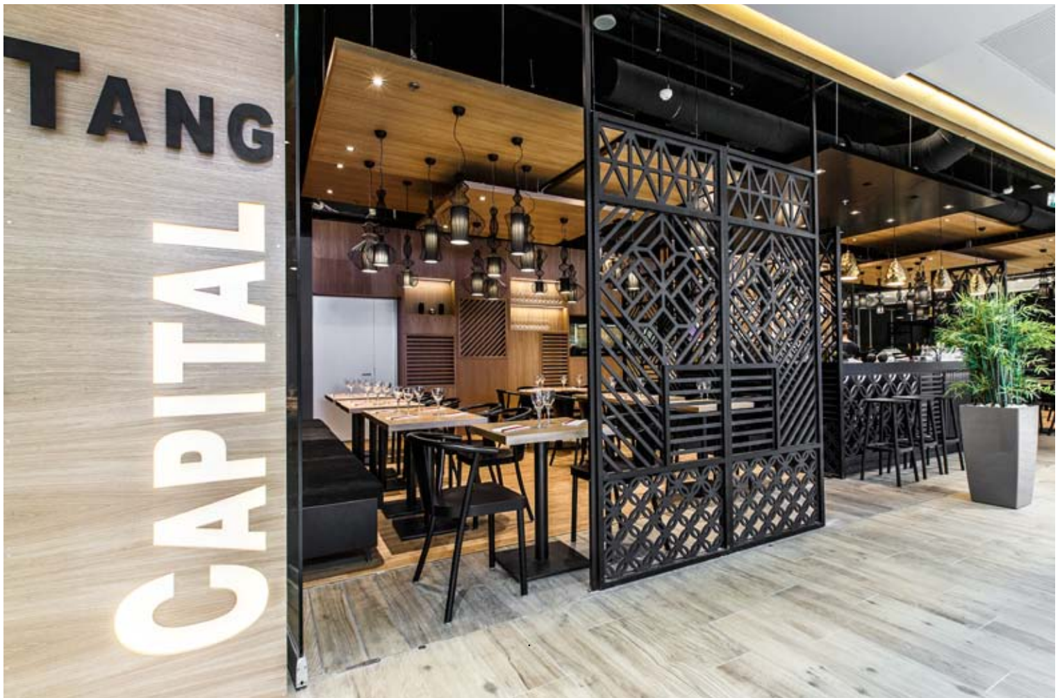
Ravintola Tang Capital Kauppakeskus IsoKrisstiina Brahenskatu 5, 53100 Lappeenranta

Ravintolamiljöön on suunnitellut palkittu dSign Vertti Kivi & Co suunnittelutoimisto.